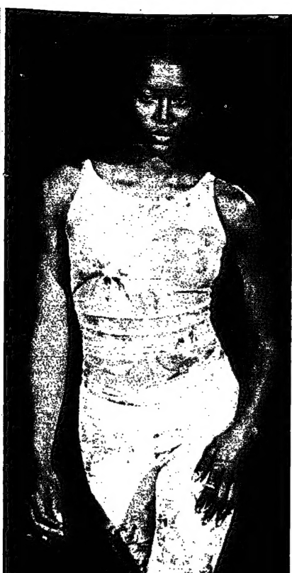
عريف الزيادة البيرونية العالمية ترمي كاس جمرتها من مسلمات دوناتولا في سباني لوسم صيف 1999 في كورنيل الجبلية لاس ازل